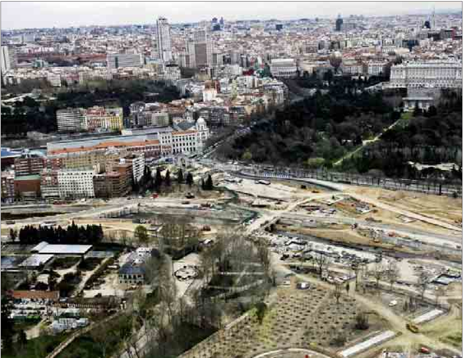
Vista general de la zona del río Manzanares y la M-30 a la altura de Príncipe Pío tomada ayer al mediodía: los coches ya circulan en el interior del nuevo túnel de casi 6 kilómetros.

Gallardón habla de «día histórico» al inaugurar el túnel entre Marqués de Monistrol y el Nudo Sur que soterra la M-30 /16-17