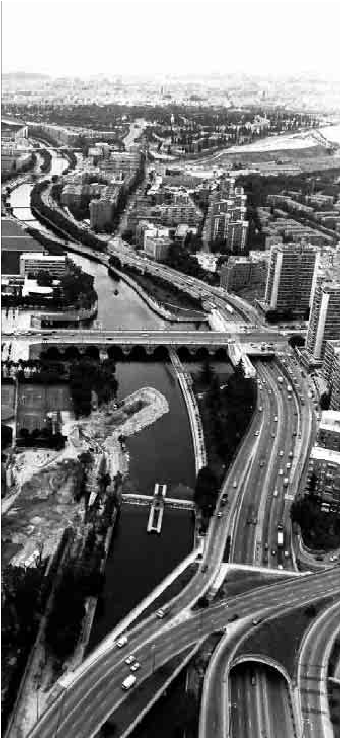
LA M-30 EN LOS AÑOS 90. El 30 de junio de 1992, el río Manzanares se veía así, como una mancha en un paisaje lleno de coches y pasarelas. La M-30 se convertía en una barrera entre vecinos de un mismo barrio.