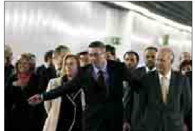
Gallardón junto a Ricardo Lagos y a ocho alcaldes.

Urbanismo. El alcalde inaugura los seis kilómetros de soterramiento de la M-30 desde Marqués de Monistrol al Nudo Sur, eliminando así los coches de la ribera del río Manzanares