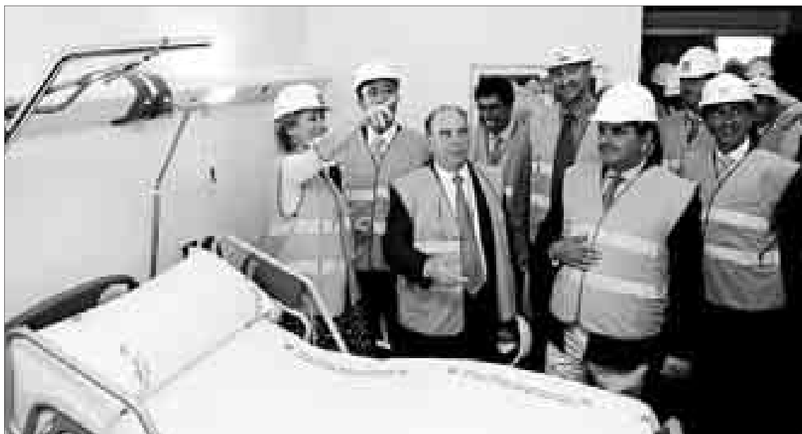
Esperanza Aguirre, acompañada de varias personalidades, visita una habitación piloto del nuevo Puerta de Hierro.

Sanidad y Consumo, Manuel Lame-la, Aguirre se adentró en una habitación piloto y se mostró «satisfecha» por el cumplimiento de los plazos en la edificación.