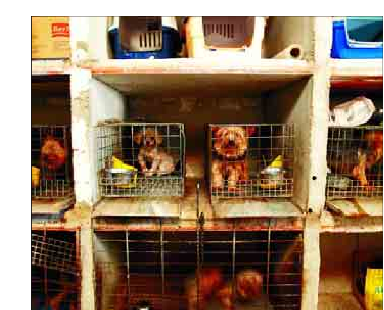
Algunos de los perros liberados por la Guardia Civil, el pasado lunes, dentro de unas jaulas.

Esta instalación, ubicada en Majadahonda, sustituirá al de idéntico nombre situado en la calle San Martín de Porres de la capital. Pasa a la página 2