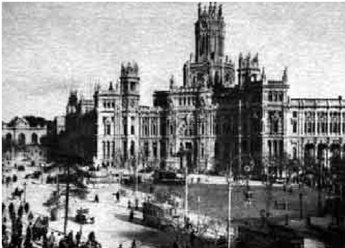
Casa de Correos, 1930.

El discurso que leyó Paz se titulaba La búsqueda del presente . Todo un lema para un alcalde con ambiciones, pero que ha sufrido varias decepciones y que es consciente de que lo único que le queda es el presente, es decir, en términos mundanos, obtener el mejor resultado posible en unas elecciones que pueden convertirse en otro trampolín dentro del PP. Tampoco la fotografía elegida para ilustrar (Pasa a la pág. 3)