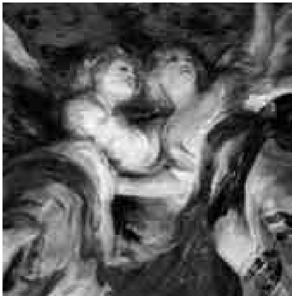
Goya. Fragmento de La Gloria de San Antonio de la Florida.

Ayuntamiento. El alcalde de Madrid recoge en su felicitación de Navidad un fragmento del discurso que realizó Octavio Paz el día en que le entregaron el Premio Nobel en 1990. El regidor hace suya la búsqueda que hace el escritor mexicano de la modernidad. En esta página se pueden ver, además, las felicitaciones del alcalde en los tres últimos años