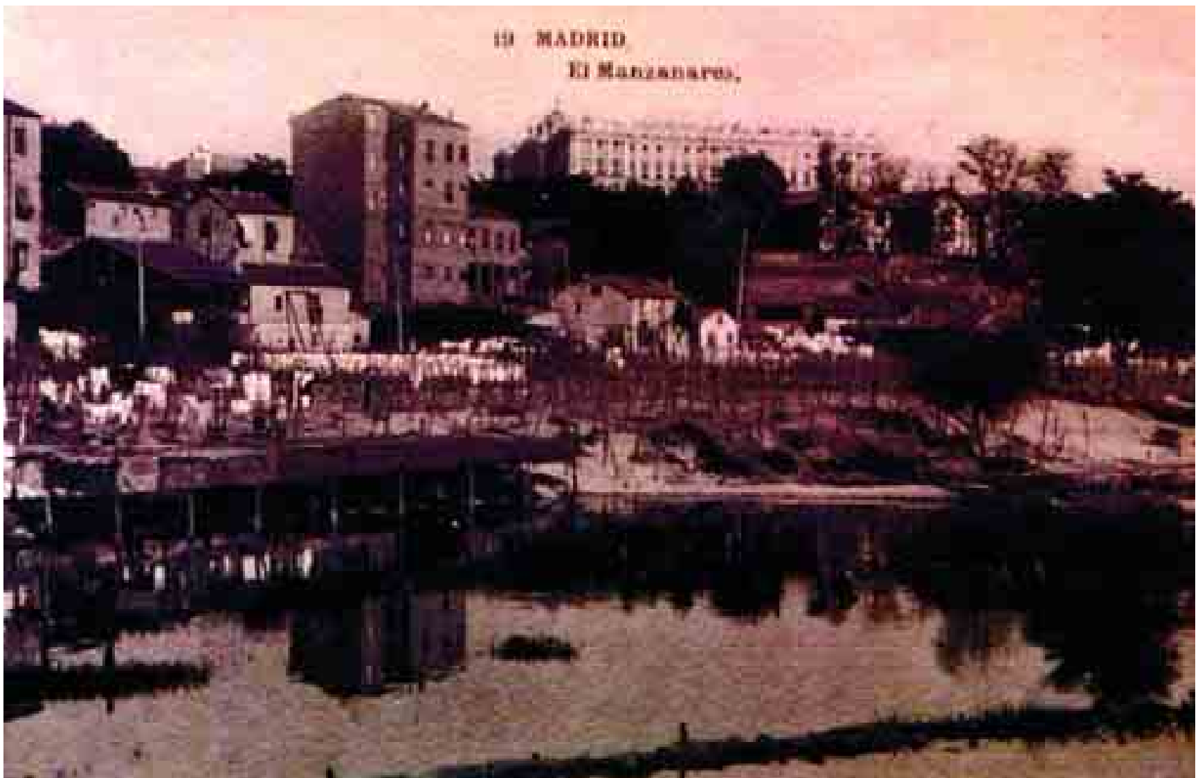
La tarjeta de felicitación navideña de Alberto Ruiz-Gallardón incluye la fotografía del río Manzanares, con el Palacio Real al fondo, y el fragmento de Octavio Paz que aparece abajo.

En mi peregrinación en busca de la modernidad me perdí y me encontré muchas veces. Volví a mi origen y descubrí que la modernidad no está afuera sino adentro de nosotros [...] Perseguimos a la modernidad en sus incesantes metamorfosis y nunca logramos asirla. Se escapa siempre: cada encuentro es una fuga. La abrazamos y al punto se disipa: sólo era un poco de aire. Es el instante, ese pájaro que está en todas partes y en ninguna. Queremos asirlo vivo pero abre las alas y se desvanece, vuelto un puñado de sílabas. Nos quedamos con las manos vacías. Entonces las puertas de la percepción se entreabren y aparece el otro tiempo, el verdadero, el que buscábamos sin saberlo: el presente, la presencia.