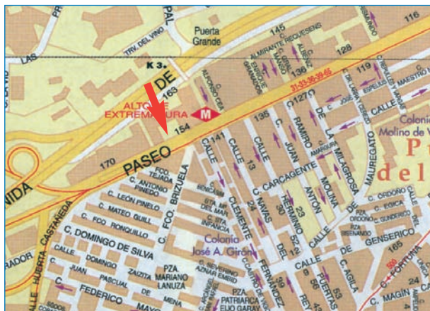
Paseo de Extremadura, 156 - 158.

El Servicio de Información y Atención al Ciudadano Madrid Calle 30 mantiene abiertos dos Puntos Informativos en el Paseo de Extremadura y la Cuesta de San Vicente, y hasta ahora ha atendido a un total de 15.838 visitas, ha distribuido 12.598 folletos informativos, y ha dado respuesta a 1.080 consultas y sugerencias relacionadas con el proyecto.