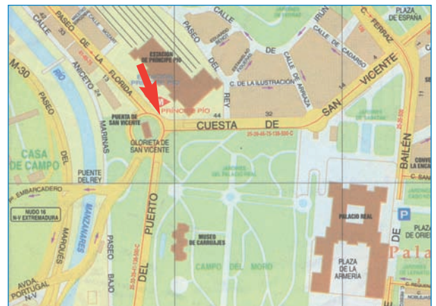
Glorieta de San Vicente, frente a la estación de Príncipe Pío.