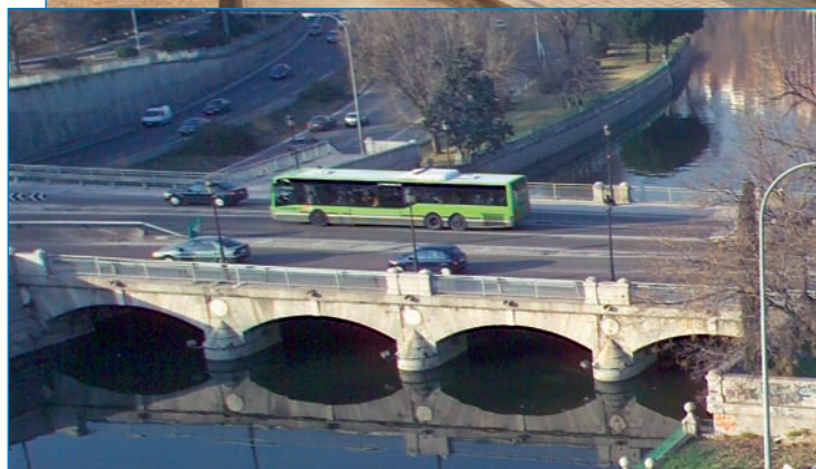
El histórico Puente del Rey soportaba el paso de miles de vehículos al día.