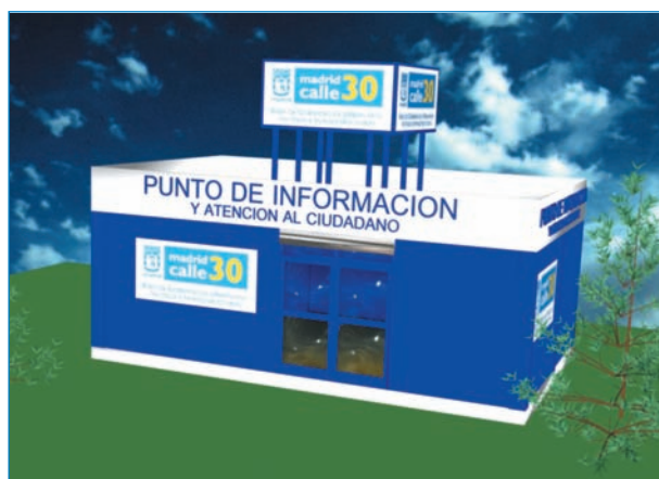
Punto de información.