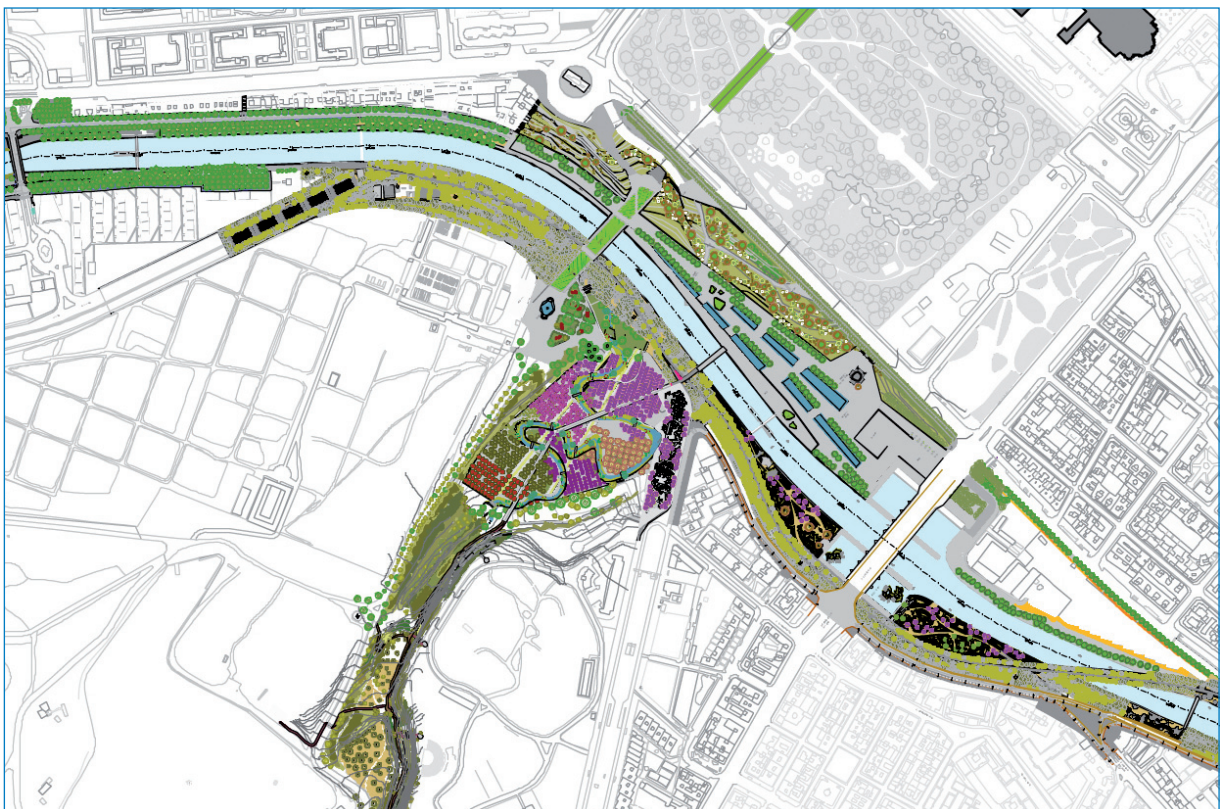
Diseño para el ajardinamiento de la superficie realizado por el equipo ganador del concurso internacional "MADRID RÍO"

El soterramiento del tramo de salida Cuesta de San Vicente-Avenida de Portugal permitirá recuperar 31.000 metros cuadrados de espacios ocupados por las calzadas, que eliminan la barrera urbana con la Casa de Campo, y se suman al parque de un millón de metros cuadrados de superficie que se creará en el marco del proyecto Madrid Río, que formarán parte de un corredor ambiental de 3.500 hectáreas desde Getafe hasta El Pardo.