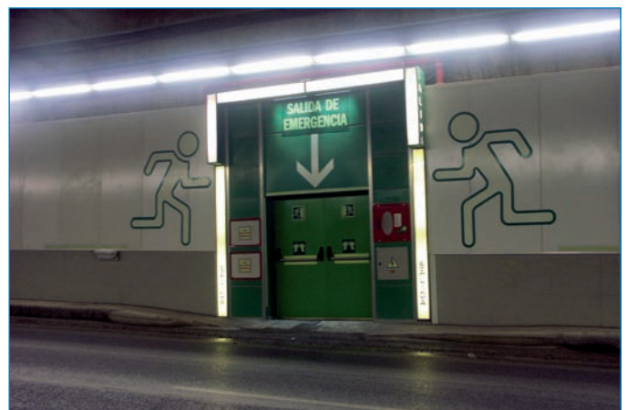
Imágenes de algunos de los elementos de seguridad instalados en el túnel.