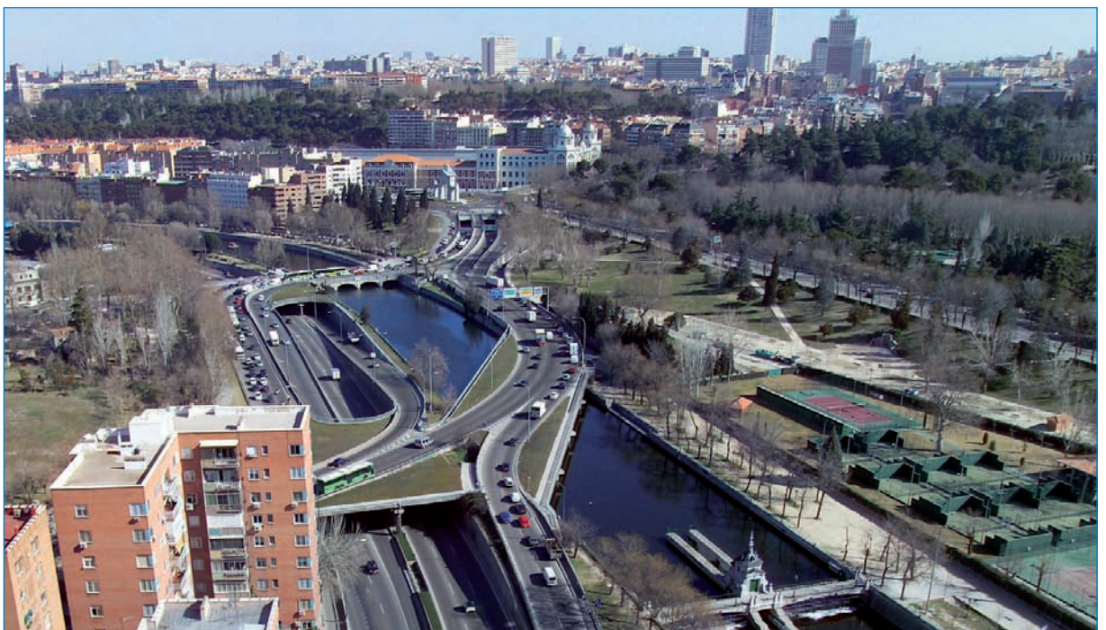
Conexión en superficie entre la Cuesta de San Vicente y la avenida de Portugal. Al fondo, Puente del Rey.

Por otra parte, el paso inferior que existía bajo la Glorieta de San Vicente resultaba insuficiente para absorber y canalizar el flujo de vehículos que accedían hacia el centro urbano y el que buscaba la salida hacia la A-5 y M-30 Sur.