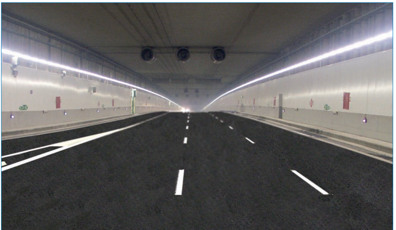
Acceso al túnel desde la Cuesta de San Vicente (arriba) y tramo central de la avenida de Portugal soterrada (abajo).