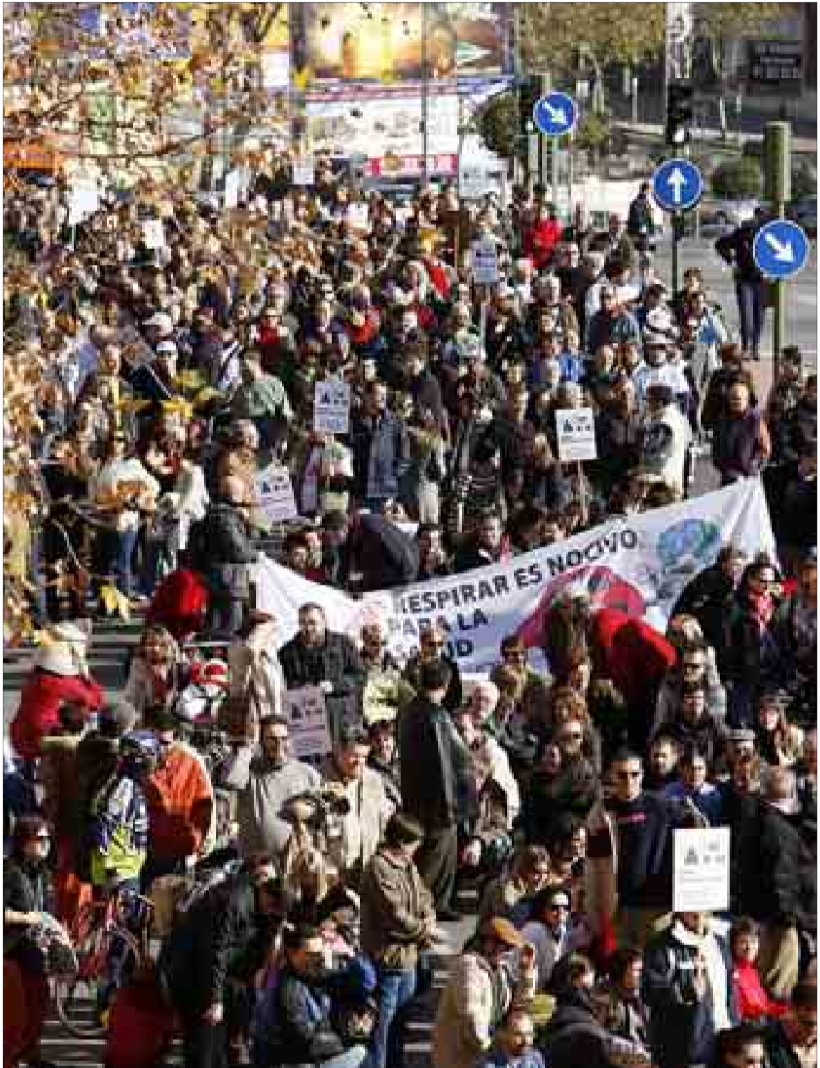
Miembros de la plataforma contra el cierre de la M-50, ayer, durante la manifestación.

MADRID.- Concejales del PP del Ayuntamiento se plantearon abandonar en el Pleno de la Corporación del próximo lunes al alcalde, Alberto Ruiz-Gallardón y no votar. La protesta quería expresar su malestar por el «engaño» del que dicen han sido objeto tras la aprobación de una inversión de 540 millones de euros para comenzar las obras del Eje Prado-Recoletos y terminar el proyecto Madrid-Río de la M-30. Sus barrios se han quedado con un 2% de la inversión. Finalmente no habrá boicot. Pasa a la página 3