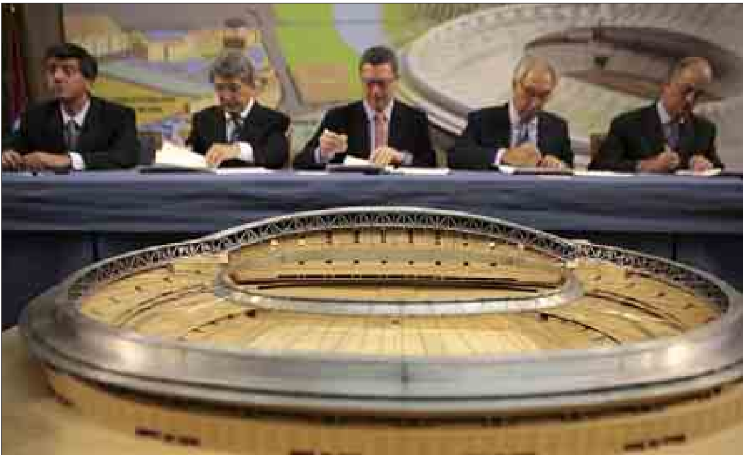
El alcalde de Madrid y representantes del Atlético de Madrid y Mahou, firmando el año pasado el protocolo de intenciones de la 'operación Calderón'.