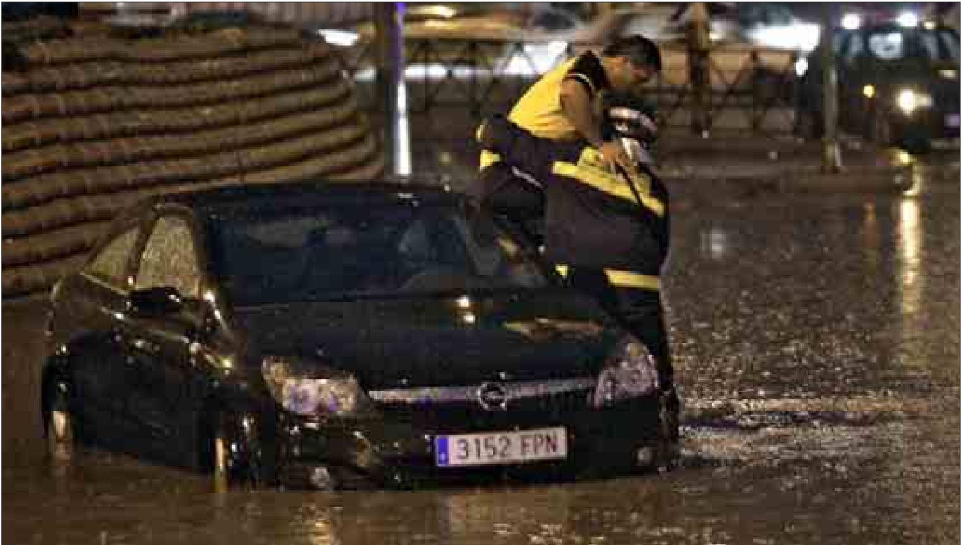
Los Bomberos del Ayuntamiento rescatan, anoche, a un joven que quedó atrapado en su coche en la avenida de los Poblados con Vía Lusitana durante la tormenta.

Inundaciones. La fuerte lluvia que cruzó ayer la región de sur a norte anegó sótanos y garajes, una buena parte de la M-30, la avenida de los Poblados y dejó atrapados a conductores en sus coches, en medio de inmensas balsas de agua. Los Bomberos de la Comunidad y el Ayuntamiento realizaron más de 350 salidas, se derrumbaron tres plantas de un edificio en construcción... La zona más afectada fue el Sur