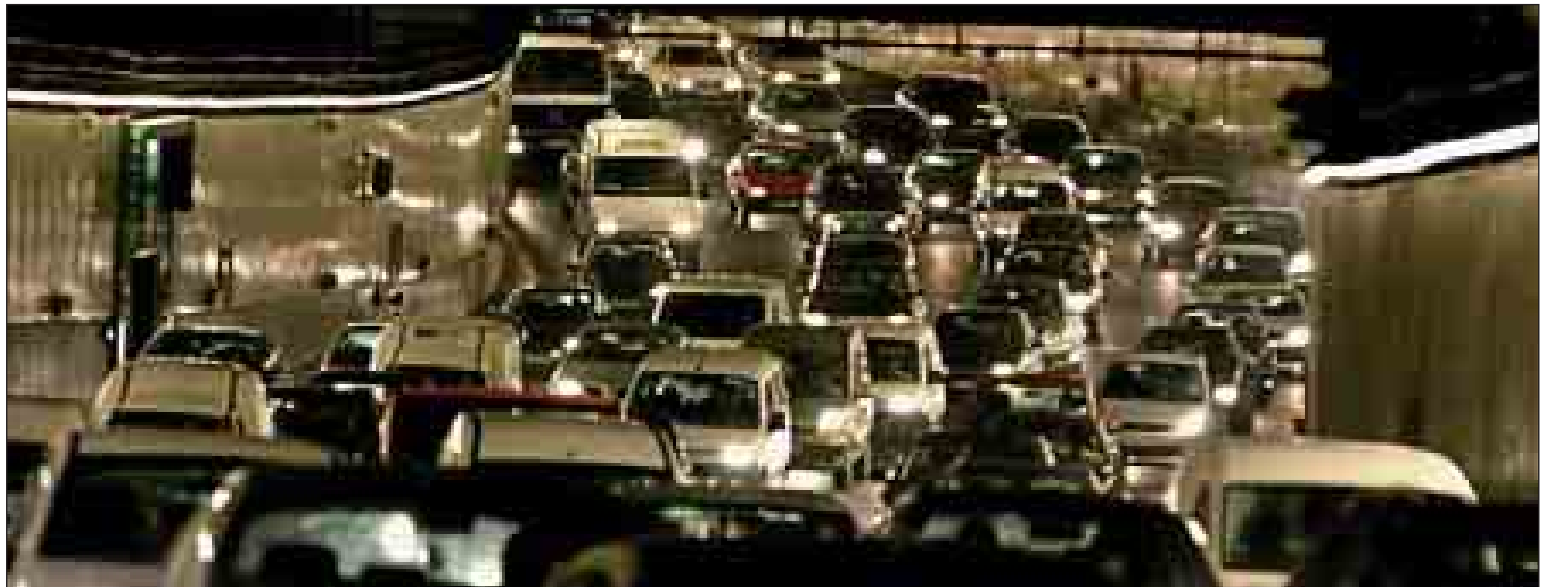
El túnel de la M-30 cercano al Vicente Calderón, ayer, repleto de coches. / JAIME VILLANUEVA

La circulación de vehículos por el túnel sur del by-pass quedó restablecida, en dos de sus tres carriles, en torno a las 11.00 horas. También permaneció interrumpida la salida de los túneles de la M-30 hacia la A-42 y el paseo de Santa María de la