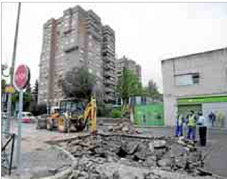
La calle de Antonio Leyva, ayer, levantada tras la rotura de una tubería.

Cabeza. UGT-Madrid exigió ayer la convocatoria de la Mesa de Movilidad para aprobar una legislación específica que resuelva los problemas autonómicos de tráfico, a la luz del caos circulatorio registrado ayer en Madrid tras las primeras lluvias de otoño. Según el sindicato, inundaciones en la estación de Me-