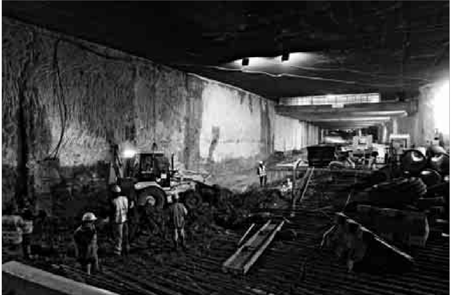
Los trabajadores de la M-30, ayer, durante la visita de Alberto Ruiz-Gallardón a los túneles de la Avenida de Portugal.

Gallardón declaró estar «encantadísimo» de mantener debates con su rival socialista cuando empiece la campaña electoral, porque, a decir del alcalde, «cuando se han hecho bien los deberes y se ha