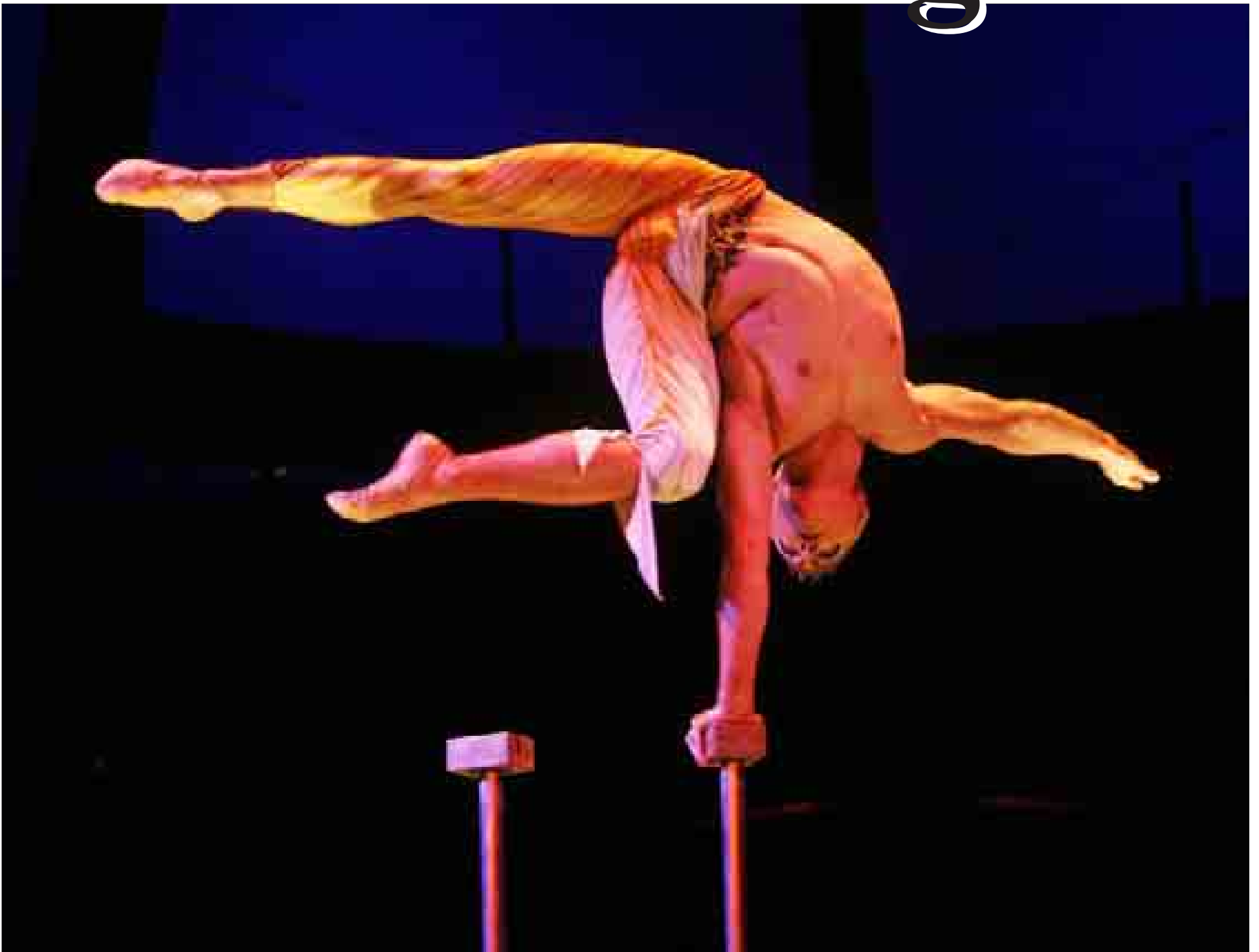
Un equilibrista se contorsiona a casi dos metros del suelo con un sólo punto de apoyo, en uno de los números del espectáculo 'Alegría'.

La magia del Circo del Sol regresa a Madrid con el espectáculo que fue su carta de presentación en España hace ocho años /16-17