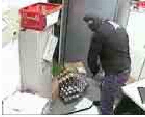
Así actuaba una de las bandas desarticuladas ayer.

Guerra a las bandas organizadas Más de 100 robos resueltos ayer tras la desarticulación de dos grupos y la detención de un peligroso atracador en Humanes En 2005 cayeron 166 bandas dedicadas a falsificación, delitos contra la propiedad intelectual, prostitución, inmigración ilegal; hubo 604 detenidos, 154 de ellos chinos / 8