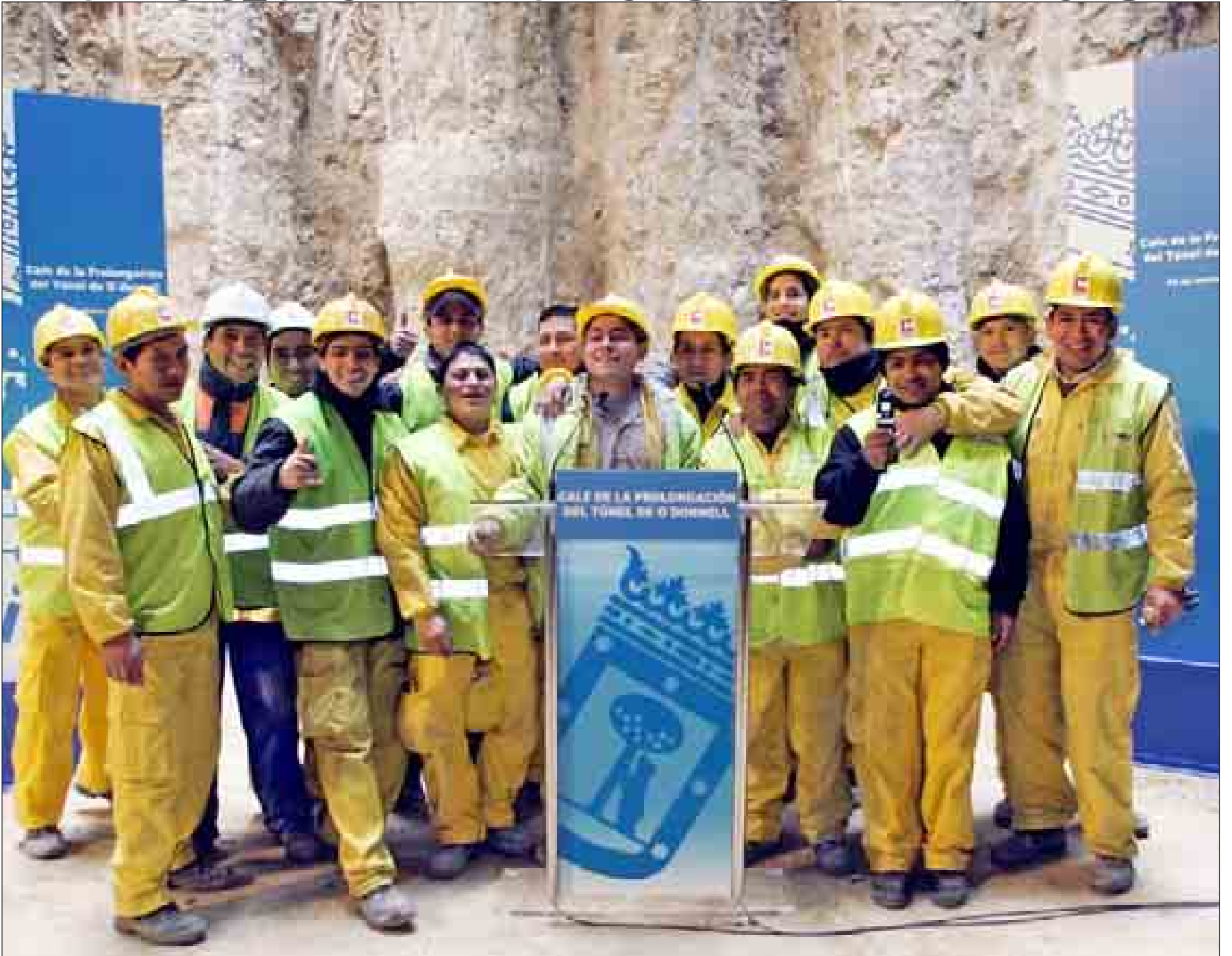
Los trabajadores del túnel de O'Donnell -la inmensa mayoría, suramericanos- también celebraron ayer la visita del alcalde y la próxima finalización de la obra.

El 90% de los trabajadores del túnel de O'Donnell, que abrirá en abril, es extranjero, como comprobó ayer 'in situ' el alcalde / 6-7