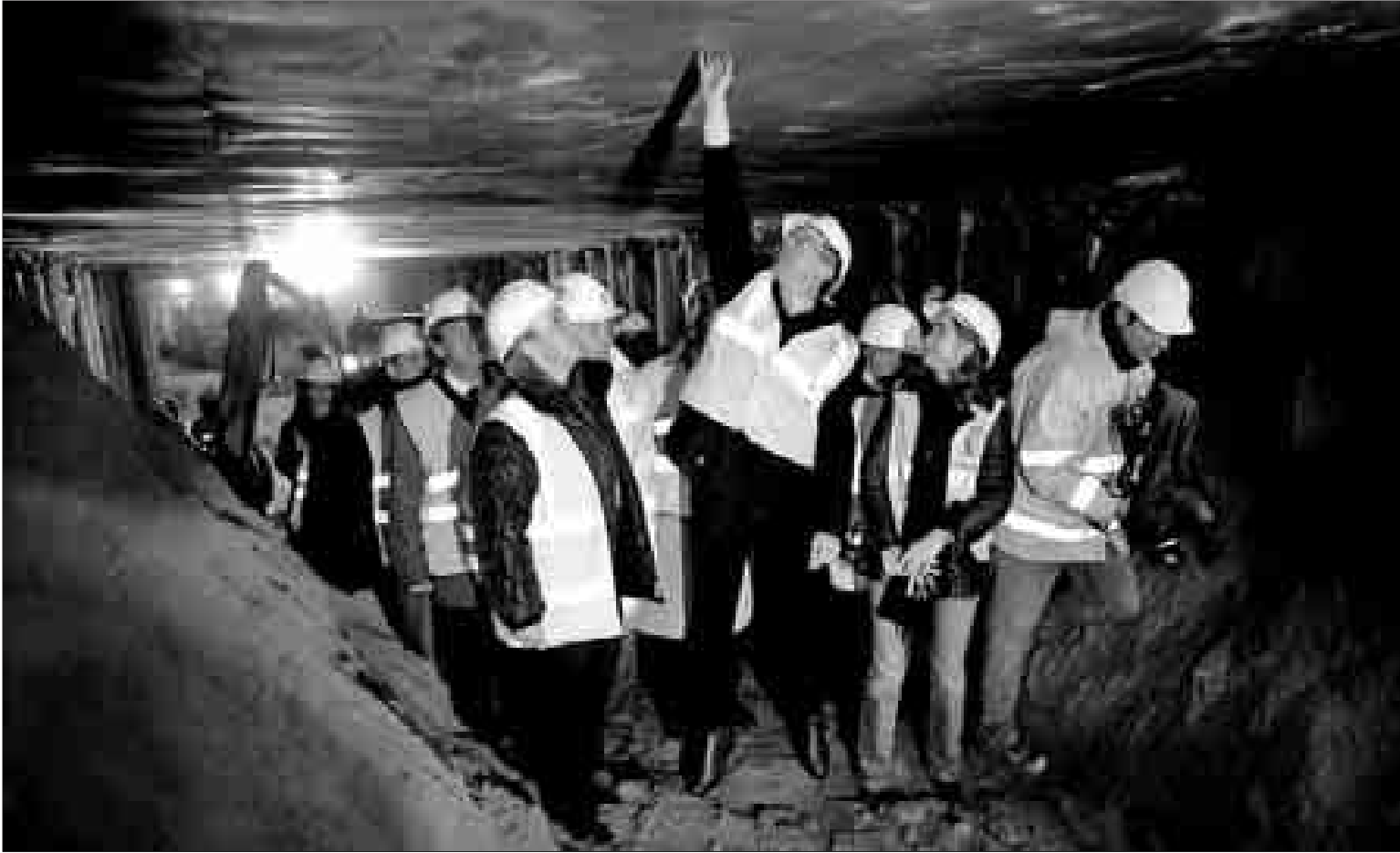
Alberto Ruiz-Gallardón toca, ayer, el techo del túnel de O'Donnell tras el 'cale' del subterráneo.

Ayuntamiento. El 90% de los trabajadores del túnel de O'Donnell es extranjero, la mayoría de Ecuador y Colombia. Ayer reclamaron al alcalde, Ruiz-Gallardón, que visitó esta infraestructura que se abre en abril, para hacerse fotos con él bajo tierra