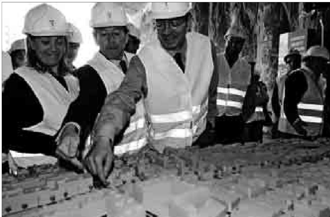
Ruiz-Gallardón y la concejala de Urbanismo, Pilar Martínez, observan una maqueta de la obra.

Alberto Ruiz-Gallardón explicó que aplicarán a la obra un criterio de máxima funcionalidad, máxima seguridad y reducción al mínimo de los trastornos que este tipo de infraestructuras deben tener para el ciudadano. Un total de 4.000 personas ha visitado el punto de información que el Ayuntamiento ha abierto en la zona mientras duren las obras.