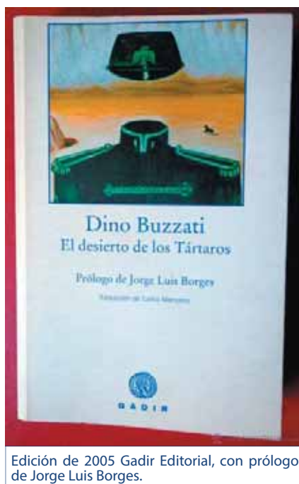
Edición de 2005 Gadir Editorial, con prólogo de Jorge Luis Borges.

En ese desierto, real y simbólico a la vez, los cambios serían dramáticos. Según quién observe, las consecuencias podrían ser nefastas, pero ¿no ocurre así siempre que nos enfrentamos a cambios que se escapan a nuestro control? Las tecnoutopías de nuestros días, anunciadas como tecnologías de movilidad disruptivas, que nos van a cambiar la vida cotidiana en un plazo mucho menor de lo imaginado por la mayoría de las